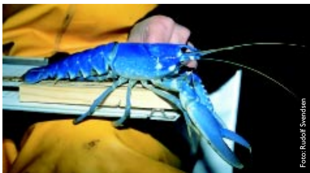
Figur 2 Hummer føret med fôr uten pigmenter mister fargen og blir etter hvert lyseblå og til slutt hvit. Ved å tilsette pigmenter i føret kan dette motvirkes.

på Kvitsøy har gitt tilnærmet samme vekst for liten yngel føret med krepsdyr, og for stor hummeryngel (30-50 mm carapaxlengde) føret med kommersielt torskefôr, som det er oppnådd i utlandet med naturlig fôr (Figur 1). Den siste perioden av forsøket ble det føret bare med torskefôr. Veksten til liten yngel avtok i denne perioden, noe som delvis også skyldtes lite areal i burene.