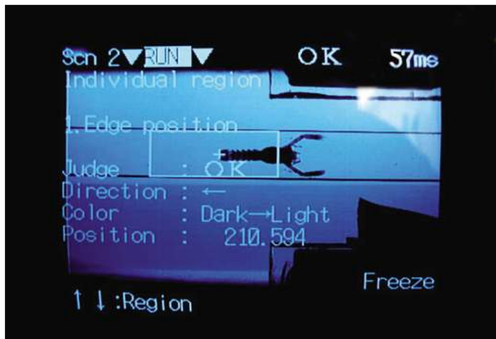
Figur 6.6.1 Skjerm bilde fra sorteringsmaskin som sorterer ut IV-stadiumhummer (yngel klar for bunnslåing) ved hjelp av billedanalyse. Screen frame of robot for sorting out stage IV lobster larvae by use of image analysis.

Det ble i perioden 1970–1995 gjennomført en rekke forsøk i Amerika på å utvikle en teknologi som innfridde biologiske, teknologiske og økonomiske kriterier for hummer i oppdrett. På grunn av lave priser på amerikansk hummer og dyr og lite utviklet data- og automatiseringsteknologi, klarte de imidlertid ikke å finne en teknologi som muliggjorde lønnsom landbasert hummeroppdrett. NLF har gjennom prosjektet på Kvitsøy utviklet og testet en rekke ulike oppdrettsteknologier i liten skala. Siden hummer er kannibal og må oppdrettes i enkeltbur, setter dette store krav til teknologiens design og funksjon. De fleste oppdrettskonsepter som har vært testet hadde vesentlige mangler (stor dødelighet, vanskelig å automatisere, stressende behandling av dyrene, dårlig vannmiljø, etc.), noe som gjorde dem uaktuelle i kommersiell sammenheng. Forsøkene har likevel vært svært viktige for å identifisere svake punkter i de ulike leddene i produksjonskjeden (Kristiansen et al. 2004). Basert på disse erfaringene har NLF utviklet og tatt ut patent på et nytt modulbasert teknologisk konsept for kannibalistiske krepsdyr som